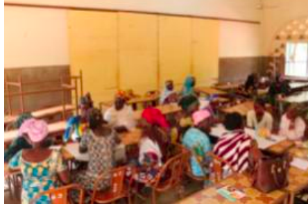
Des travaux de groupe dans le cadre du partage d'expériences sur la commercialisation.