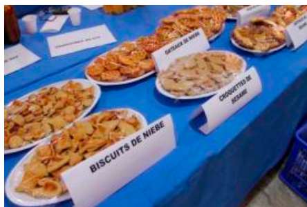
Confection de mets locaux par les participantes et dégustation.